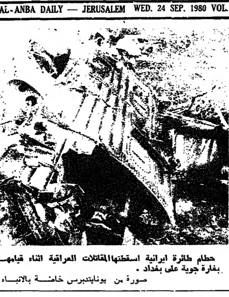
حطام طائرة ايرانية اسقطتها القوات العراقية اثناء قيامها بغارة جوية على بغداد.

بغداد، طهران - صعقت امس العراق وايران المارك بينهما حيث استخدمتا الصواريخ والطائرات والمفعية، وتحاول قوات عراقية حالياً محاصرة منطقة عبندان النفطية بالناط و احتلال اقليم خوزستان كليا، بينما قامت الطائرات الايرانية بقصف العاصمة بغداد وعدد من المدن العراقية الاخرى. واعلنت طهران عن غلق مضيق هرمز في حين هدد العراق باحباط كل محاولة لمرقعة الملاحة في الخليج الفارسي. ودعا الرئيس الامريكى لعدم التدخل في الحرب العراقية - الايرانية واجرى اعضاء مجلس الامن الدولي مشاورات غير رسمية تمهيدا لاتخاذ قرار ينادي بوقف القتال.